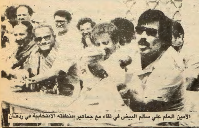
الامين العام علي سالم البيض في لقاء مع جماهير منطقتة الانتخابية في ردمان

وسط ضجيج اعلامي مشبوه تموله الامبريالية الاميركية والرجعية اليمنية لتشويه صورة اليمن الديمقراطية، وانجازاتها في تخطي اثار مؤامرة ١٣ يناير، تقدم القيادة الحزبية والسياسية في عدن الدليل تلو الدليل على امساکها بالحلقة المركزية في معالجة الظواهر السلبية والخطيرة والخطئة التي شابت التجربة. هذه الحلقة المتمثلة بالتمسك بالديمقراطية في العلاقة مع الجماهير، وبالديمقراطية المركزية في العلاقات الحزبية، وفي التسامح مع العناصر المغرر بها، وعدم التساهل في الدفاع عن الثورة والنظام التقدمي في اليمن الديمقراطية وخياراتها الايديولوجية والسياسية.