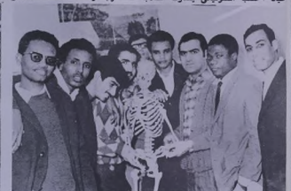
مجموعة من الطلبة الكورسيين والطلبة الاجانب في اسم - الخصومية ( طلب ) .