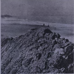
طلاية طليمة ان تقوم بدور التوعية لارواح شمعنا وتعرية المخططات الاستعمارية الرجعية التي تزداد عنقا وشراسة في هذه المرحلة الحاسمة .

اننا مطالبون اليوم ان نندم خطوات اكثر ووسع فسي مجال دميعة للثورة المسلحة في الخليج العربي مطالبون كجماعه