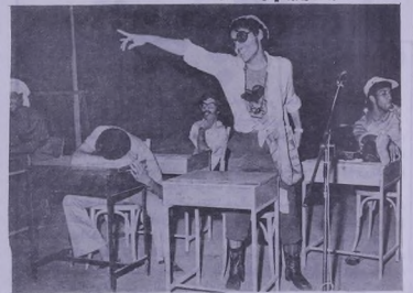
— عزرة صديقه بهيما « الاتحاد الوطني لطالبة البحرين »