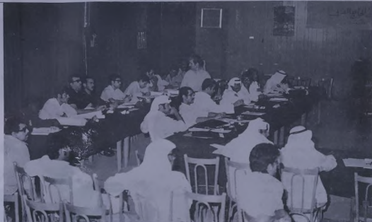
لقطة من المؤتمر السادس للإتحاد

في هذه الفترة بدأنا نشعر بالفهم واللبس المقتنع من بعض المسؤولين ، وبدأت اصابع « الحش والترض » الرخصة تتناول بعض أعضاء الهيئة التنفيذية بل الهيئة التنفيذية والإتحاد بكامله ، والبعض في هذا المجتمع له قدرة عجيبة في تصنيف الآخرين ونعت ممارساتهم بالتبوء