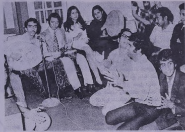
جانب من حفل التعارف السنوي

الهيئة الادارية السابقة اثناء مبايعة التفريرين امين والمدي .