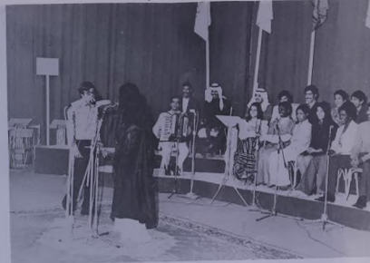
١ - اللجنة الثقافية :

في العشرين من نوفمبر أقيمت اللجنة الثقافية أولى لقاءات برنامج التنقيص الثقافي . هذا البرنامج تقرر أن يكون مدته من كل أفراد كل دمنه ٦٠ طالبة وطالب بقسمه على أربع مجموعات ويسمى خلال هذه اللقاءات استعراض ومناقشة عدة مواضيع ثقافية وطلاوية . البرنامج الفرع .