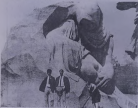
بعض طلبنا في رحلة اثرية لسي الاتحاد السوفياتي .