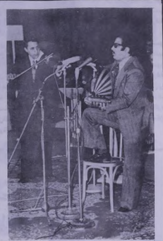
أحد الفنانين الكويتيين في ورشة فنية