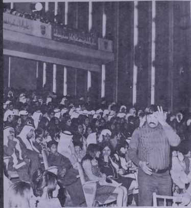
جنب من الحضور