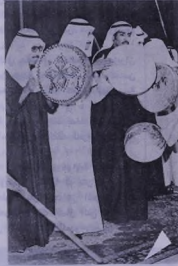
أحد فقرات الرقص الشعبي « العرصة »