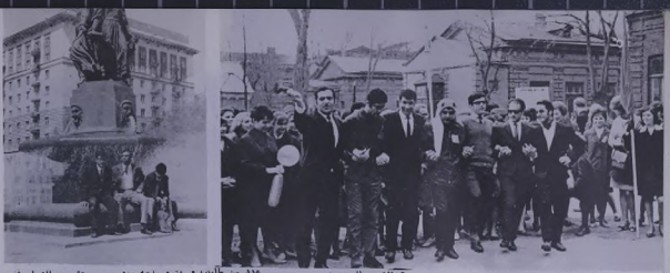
مجدد من طلبنا في منزله راحة يوم بوم برحل من الغرامه .