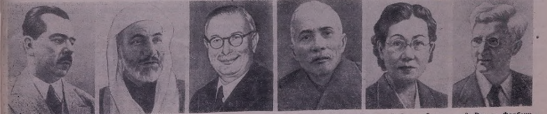
1. Ласаро Карденас— президенте Мек'сикейи бэрэ 2. Шех Мухаммед-ал-Амид— э'в'һиһиһиһе мөх'лүдөти (Сирия) 3. Зозеф Вирт— рейксслэнде Германияи бэрэ (Республика Германияи Федерал) 4. Тон Дик Танг— сөдрө комитетэ Мьянме иа фронтэ Вьетнамайэ В'р'өһиһе 5. Акико Сэки— э'в'һиһиһиһиһа кустване (Япония) 6. Ратгар Фөрбек— пастор, қанане дьрэ бажаре Ослое (Норвегия)