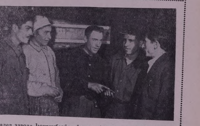
Փալա շահադ Երմոնիստանա ընթացիկներն Ա. Բաճ, Մ. Խոստեն, Ք. Վարձանյան Ք. Սուլեյմանյան Բոնա Իրմոնա շահադ շահադ 200—250 շահադ ֆրոնտա ընթացիկներն:

Մեր արևմտյան սահմաններում, որտեղ մեր զորքերը պարտիզանական զորքեր են կազմակերպում, մենք հարձակվում ենք հակառակորդների վրա 1960 թվականի մարտի 28-ին: