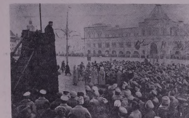
В. И. Ленин аб Майдана Сор рожэ саловхота а'йла революциона Ок- тябрьеа Социалистийа Мазын к'ельме дьбежа. 7-е ноябрье сала 1918-а