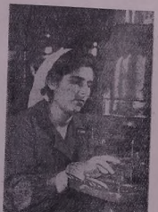
Փալա շահադ Երևանի ԿՊՍԿ Ա. Ավայան պանա փիր ըրե՛ շեճ շեճան:

Մեր արևմտյան սահմաններում, որտեղ մեր զորքերը պարտիզանական զորքեր են կազմակերպում, մենք հարձակվում ենք հակառակորդների վրա 1960 թվականի մարտի 28-ին: