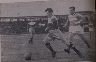
Моментак жӱ листьке.