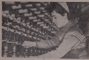
С. Аг'дәриән п'әлә комбинатә һәвәриәчә пәшә. Әв ван р'ожадә нә дәлә сәкәстәдә у пәләд хуәвә р'оже бә 125-130 сәләфә фәдә.

К'ббәра Сәо дәрсләра гәндә Бәр'әж лә нәй'иә Тәлиә.