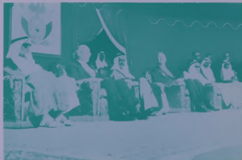
صاحب السمو الحاكم المعظم بتوسط امير ملكين رئيس مجلس ادارة شركة الكونستانت الامريكية والشيخ لبيز رئيس شركة نفط نبي وسمو الشيخ صقر بن محمد القاسمي حاكم رأس الخيمة وسمو الشيخ احمد بن راشد الملا حاكم أم القيوين في المصراخ الكبير .