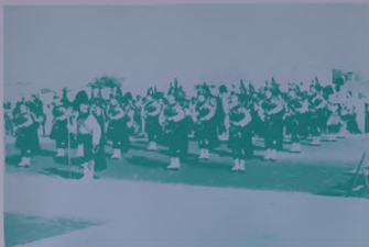
فرقة موسيقى القرب الملكية البريطانية تعزف الألمان الشعبية أثناء الاحتفال بالشمس.