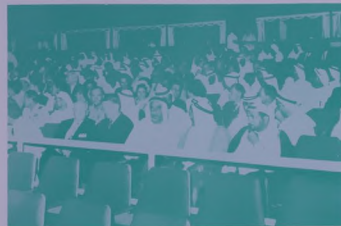
المعزومين من اصحاب السمو حكام الامارات الضالمة المشيقة يتوسطهم حاكم الدولة العظم بيرالجون العرش السيمفوني لهفته بيبي .