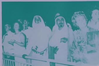
اصحاب سمو الشيخ راشد بن محمد القصبي حاكم عجمان والشيخ حفيظ بن محمد القاسمي حاكم راس الخيمة وعسجد مسن المدحون والمدحوات يراقبون اطلاق الصواريخ الثورية .