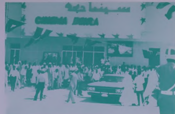
مئات المعزومين والمواطنين يؤمنون مسالة سينما بيرد لشاهدة فيلم تصويري عن نهضة بيسي .