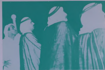
الحاكم اعظم يرهب عرض الصواريخ الثورية عشية الاحتفال الكبير .