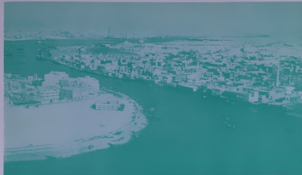
شظرا المدينة : دبي وديره ٠٠ ومياه الخور الزمردية تعكس صورتها .