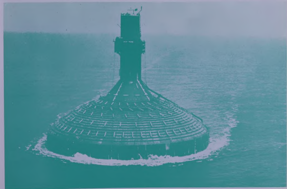
اضخم خزان للنقط من نوعه في العالم يخال في عرض مياه دبي