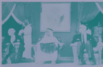
صاحب السمو الشيخ راشد بن سعيد القطوم اعظم ويسعد المصراخ الكبير يوم الاحتفال التاريخي بإضاءة المصراخ عن النصب التذكاري لانتاج النفط في دبي .