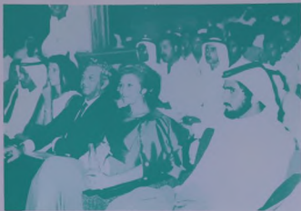
سمو الشيخ محمد بن راشد رئيس دائرة الشعطفة والأمن العام أثناء حفل المساهر الذي أقيم على مسرح نادي النصر احتفاء بالمناسبة التأسيسية .