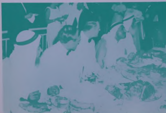
كبار المعزومين ، يشاهدون عرض الصواريخ التاريخية العظم الخلاب على مقربة من قصر زعجيل العاصي اثر مأبة العشاء التكريمية التي القاها الحاكم العظم بهذه المناسبة التاريخية .