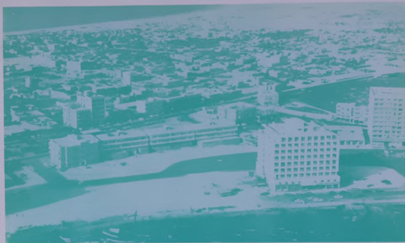
ديره ٠٠ المدينة المتطورة الواثبة بصمت