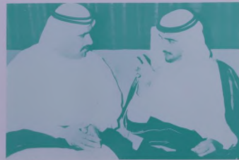
سمو الشيخ حمدان بن راشد رئيس البلدية في حديث ودي مع سمو الشيخ سورور بن محمد ال نهجان رئيس بلدية ابو ظبي .