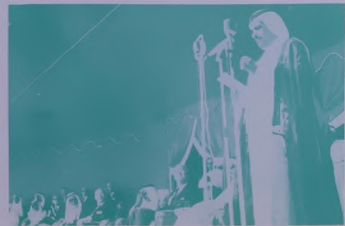
صاحب السمو الشيخ حمدان بن راشد القطوم رئيس البلدية يتلقى كلمة الحكومة تعبارة عن والده الحاكم المعظم .