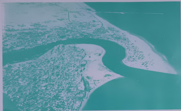
دبي ٠٠ فينيسيا الخليج وميناؤها الذي ينشأ حاليا ليصبح اضمح ميناء في الشرق الاوسط