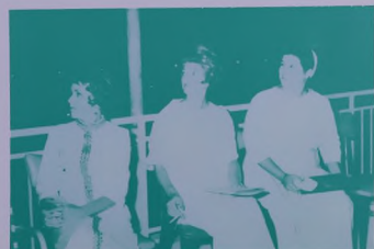
المدحوات اللواتي تبعن عهدهن مساهر الاعجاب والدمعة أثناء عرض الصواريخ الثورية اثر مابية المشاء التكريمية .