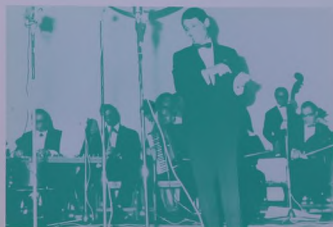
الحزب عبد الحليم حافظ يتلاعب بمساهر ملك المدحون في الحقل الفني المساهر .