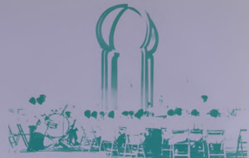
على ممثل المدينة ، يقف النصب التذكاري لانتاج النفط في دبي . وفرقة الموسيقى تعزف السلام الوطني .