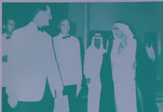
صاحب السمو الحاكم العظم في استقبال سفارة الطقم السياسي البريطاني في البحرين وسفارة المحند السياسي البريطاني في دبي .