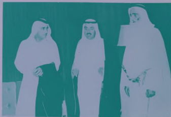
سمو الشيخ مكتوم بن راشد ولي العهد العظيم ورئيس دائرة الأراضي والمساحة يستقبل سمو الشيخ راشد النعيمي حاكم عجمان وسفارة الشيخ بدر احمد محمد السياح رئيس مكتب دولة الكويت في دبي .