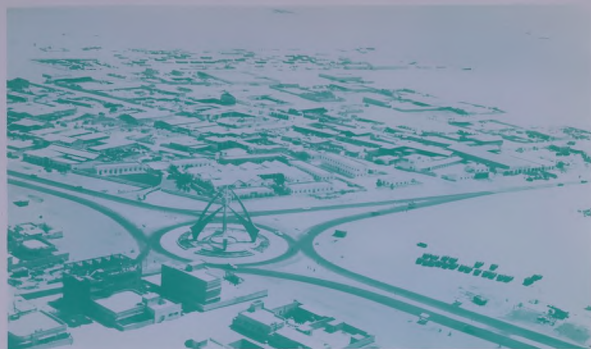
برج الساعة ، البناء التشكيلي الرائع الذي يستقبل كل زائر للمدينة