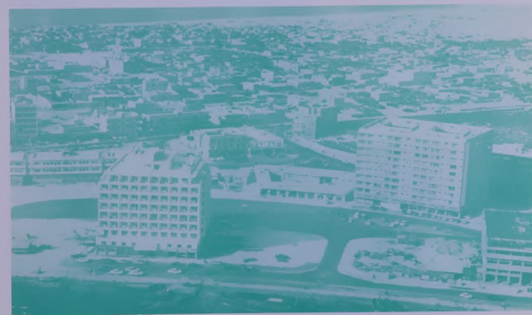
نهضة دبي العمرانية تسبق الزمن