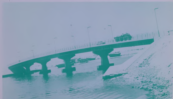
جسر المكتمل الذي يصل شطرى المدينة والذي يحول حاليا الى جسر متحرك