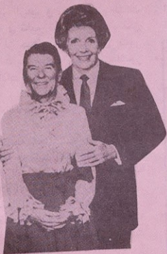
ريغان في ثياب زوجته ونانسي في ثياب زوجها : غرائب أمريكا