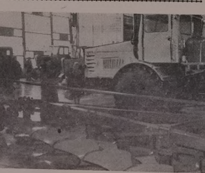
Завода Ервенецк'и сар наие С. М. Кьорьнеда ськ у шьр'эв'эшар к'эишк'эричар т'эзи бь т'эишк'эричар чьадэи чьадэи у дь нава сьмак'эричар к'эишк'эричар махьм махьм дьна. ШК'ЭЛ'ЭДА: дьтэишк'эричар ше чьекьрике.