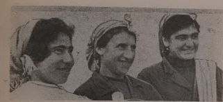
Ийванатхэикькере совхоза Мрганате (сорьертнай Эимманей дэрание) иле эедекьрына дэрания шрада гиньыэе дастаней борьба'а.