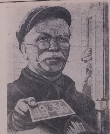
с новым годом!

Плакат йа шыкьчи В. Коретски