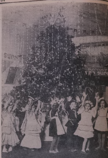
Ль мөк'тәбә Ереваней №80. Дора дара мәрхәйә сала тәзә.

вәләтә бәһәрдә тәсәми хәбәтә кыриә 13 электростансидә дитәиә. Нәһә ль Булгарияиә нинә шедә жыиә һатәйә электрификациякыриә, кәһрә дәмькыриә қар пәншәна йә бәһәлдә вәләт. (ТАСС).