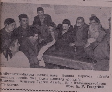
«Йһ'аишант'хвэй»ред колхоза нава Ленинэ мөрг'өзэ һон'ийа хампизине насийа хвэ дьдын өынатед фр'ылт'е.