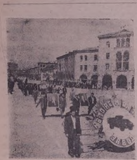
Кировскан: демонстрация хэбэт'арэ лэ майдана Кировэ.