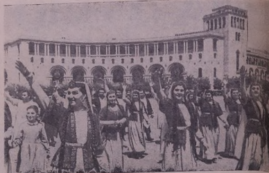
Ереван: демонстрация хэбэт'арэ лэ майдана Ленинэ.

Коллективэд дэстыхэнед п'ай'эх'тэ натыйа Ленинне дэст бы демонстрасиэа хэбэт'аред Ереване-