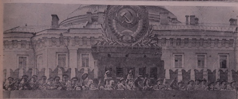
Москва. Майдана Сор. Сор'аред партиае у й'ёкмэте дь сор' трибуна Мовзолее.

Сьлава алави хэбатчиед прессер'а, ордийа мьчалэ- даред п'алэ у гөндир'а!