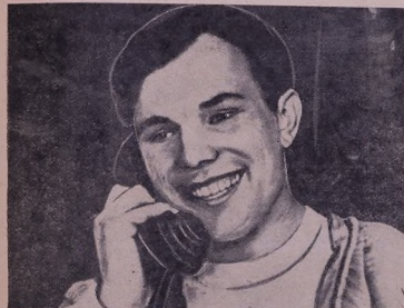
Пешданын Вор'ян һата фэдылэне. Космоседе э'влын Ву. А. Гагарин дакхде дьва һовале Н. С. Хрушчов, воки эв сар' у сыламат пэрэри'а сэр Э'рде.

и'эсэбкырене, чава дэстпбуна дэврана г'эза дь дэрэша г'эс- димихоакырына Космоседа. Жере ам чонд шьдле ме чэм- наидына мазын пашыр дькын.