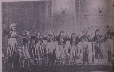
Шкъалда: к'ома радасэ йа гонде Гылькэ нэ й'омий Талине ле олимпиада республикне дэдында радасэ к'орманше шЪмаэтие «ной тэра».