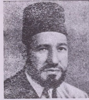
الاستاذ الشيخ حسن البنا

من هو عيسى البنا؟ وكيف بدأ تأسيس الجماعة؟