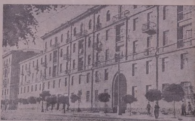
Алие жийиний т'эз с'ор с'ессад б'аман б'ори сала т'эз к'экинед. бакаре Ереваний Барекмут'ише, и