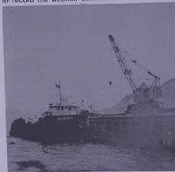
Because of the inaccessibility of the area, the LAMNALCO TERN will have to remain in the Kuria Muria Bay throughout the survey to take after and maintain the equipment.

Single buoy moorings are designed to withstand high seas and winds; but it is essential to know the exact sea and weather conditions before they are installed. From May until September the monsoon whips the sea into a cauldron of fury and there is little or no shelter along the southern coast of Oman. It was therefore decided to conduct an hydrographic survey over the next four months to record the weather conditions at their worst.