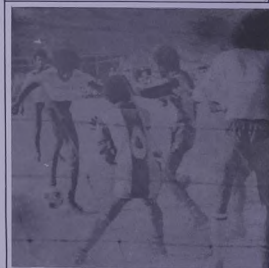
دفاع السيب تاتي في المباراه الاولى

وبعد انتهت البطولة الثانيه ضمن مسابقات شركة تنميه نطق عمان المحدوده والتي ستقام سنويا باذن الله تشجيعا ومشاركه للمساهمه في النهضه الرياضيه الكبيره التي تشهدها السلطنه بقيادة حضرة صاحب المياله السلطان قابوس بن سعيد المعظم . ميوك لعمان وحظ اسعد للفريق التي شاركت في مسابقات الرياضيه .