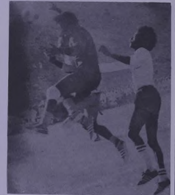
حارس مرمرى السيب يبعد كرهه عاليه عن مرماه