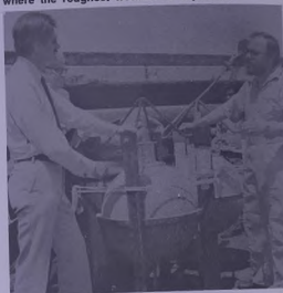
The wave rider buoys are securely fastened to the deck of the vessel. When placed in the water each one will have a flashing light for identification and an aerial to transmit the signals indicating the fluctuation of the waves.

The ship carries four wave rider buoys, one of which will be positioned off Ras Shauqirah where the roughest weather is expected.