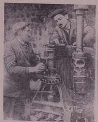
Ш'ық'ада т'аэзкырына трактора колхоза г'аэде һалбаньна д'аэ һаһ'иэ һ'аэкет'ербиэне.