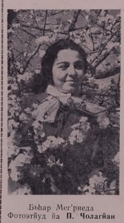
Б'йбар Мер'г'изеда Фотот'юд йа П. Ч'олаг'иян