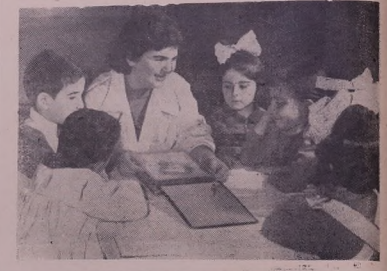
Ереван. Т'арб'и'юлд'ара баг'ице зар'э'я № 44 Ш. П'анос'иян зар'э'я р'а даржага зар'от'ийа Ленинда ш'р'вада'к'э.