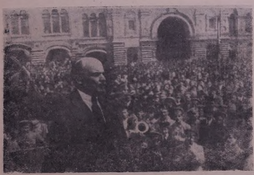
25-е майе сала 1919. В. И. Ленин Москвада, дь майдана Сор бор аскор хабарда. Кинокар.