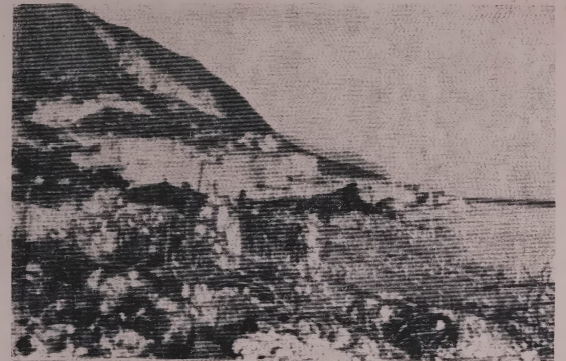
مدينة رخيوت الباسلة ، لقد حولتها الطائرات البريطانية الى انقاض بعد ان فشلت القيادة الاستعمارية في اعادة سيطرتها الاستعمارية عليها .

بتاريخ ٣-١٤ وفي تمام الساعة السابعة صباحا قامت مجموعة القناصة التابعة لوحدة هوشي منه بعملية ناجحة على مواقع العدو في مرتفعات اكوت نتج عنها قتل اثنين من جنوده وفي نفس اليوم الساعة الثالثة مساء كررت المجموعة عملية الاقتناص للاعداء في نفس الموقع مما ادى الى اصابة اثنين من افراد العدو خسائرنا في العمليتين لا شيء .