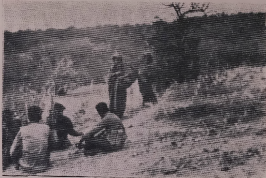
منظر مالوف في ريف ظفار المحرر . يعكس مدى التعاون الوثيق بين المواطنين والمناضلين مواطنات يحملن قرب الماء لاسقاء احدى فصائل جيش التحرير الشعبي .

بتاريخ ٢-٢٥ قامت مجموعة الاسناد بقصف مدفعي على مواقع العدو في مرتفعات الشبيحية بالمنطقة الشرقية استمر القصف لمدة ساعة شوهد العدو على اثر ذلك وهو يخلي ثلاثا اصابات من افراده خسائرنا لاشيء .