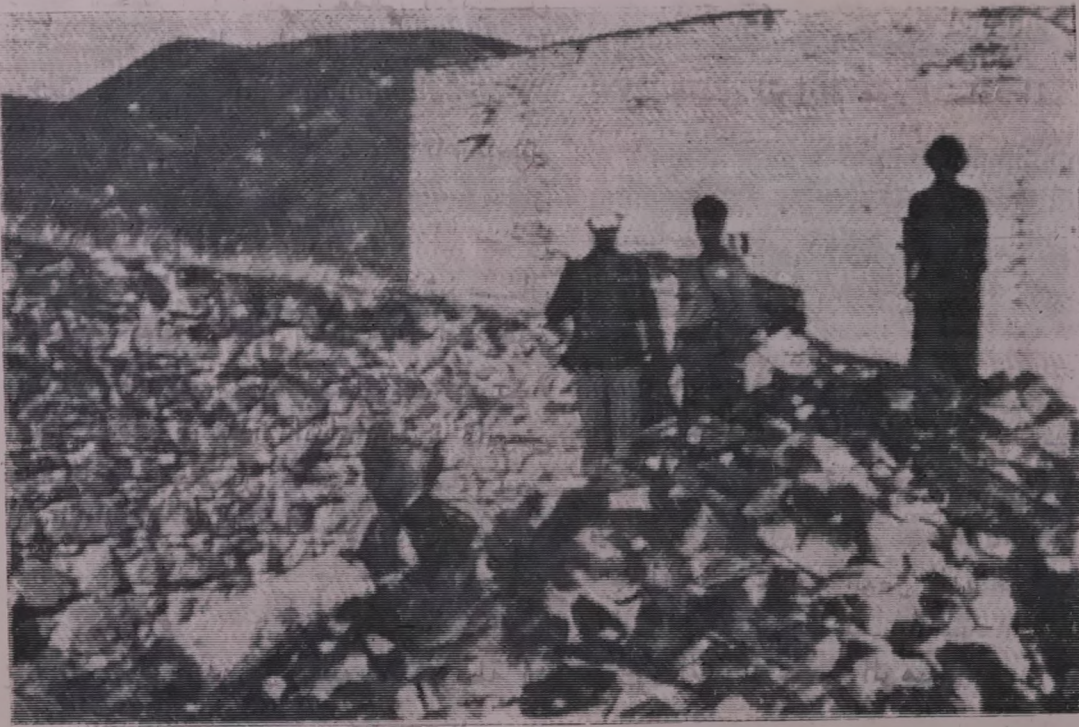
احد الصواريخ البريطانية المحرقة الذي لم ينفجر والتي تلقى يوميا وبكميات كبيرة على ديار المواطنين ومزارعها وذلك ضمن محاولات الاستعمار البريطاني الى اخضاع ارادة شعبنا بالقوة .

ان المؤامرات التي تدبر ضد النظام التقدمي في جمهورية اليمن الديمقراطية