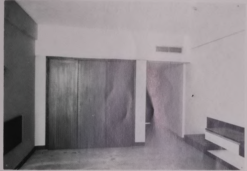
Typical Guest Bedroom (Unfurnished)