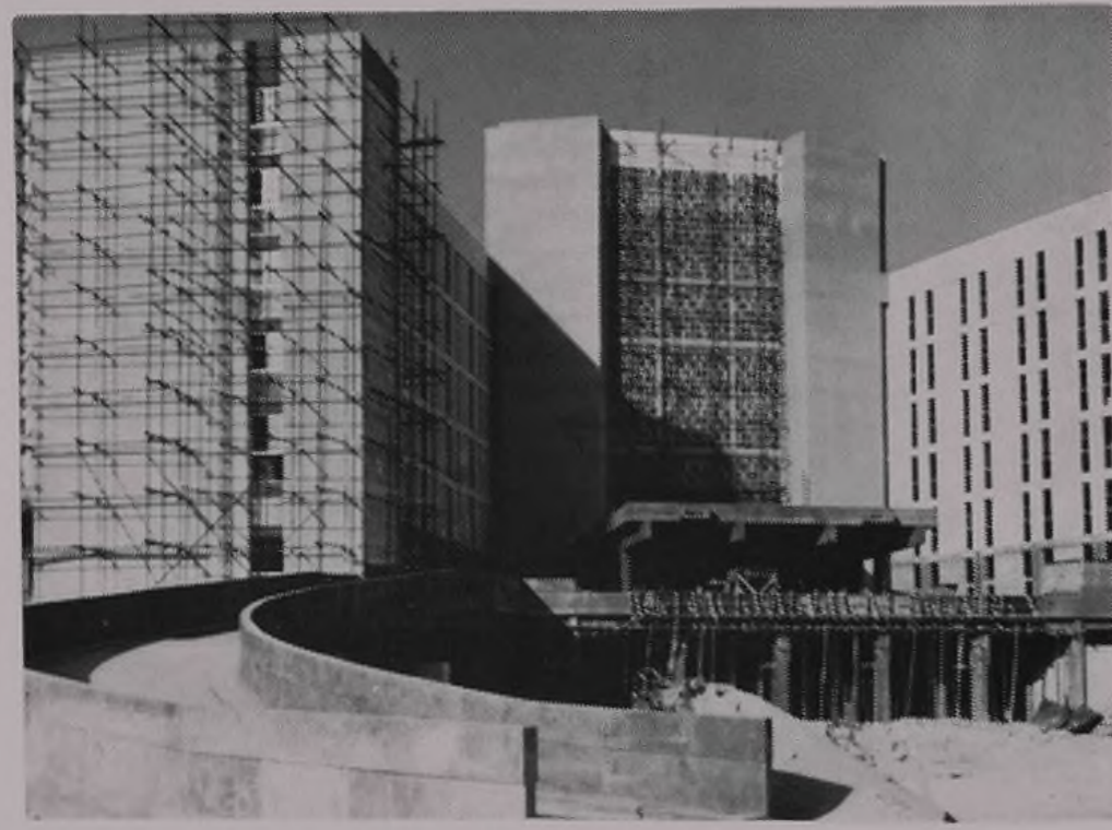
View of Front Reception Area