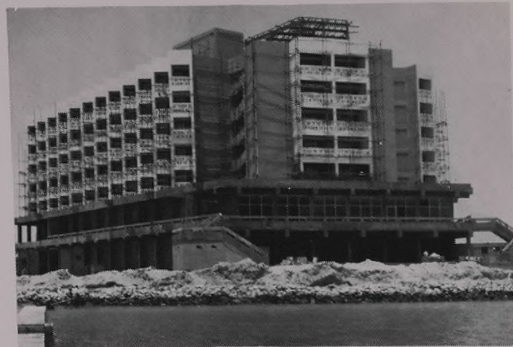
Rear View of Building Showing VIP Suites Dining Room & Swimming Pool Area