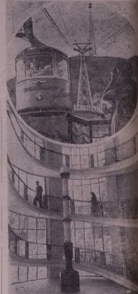
Шкык'әдә рйа һәлә һөһәдә, дөһө бор бь, Функиһулооре.