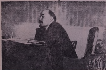
В. И. Ленин ль Пленума КМ ПКУ (б) Кремледа. Москва, 5-е сентябрье сала 1922-а. (Фото йа Л. Красин).