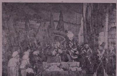
Сьфәтә жь опера «Давит Бек» бь фәдәндәиә коллективә театрә оперә-ә у бәләгәтә сор нава Спендариан.