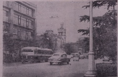
Шкык'әдә проспекта Тбилисеийә Рус'әвәли. Аһне ч'әһе аһәвә пәшһирәтә «Заря Востока», к'әлжә ве трестә «Грузугол».

Щымаэ'та гөр'нә әйлә хьөв дәстәндә мэзынә дэвә к'һышә Әв бь дьл әңц дьхэбтә бона ф' дәһив у зәдә қөлдәдывә пешдә дөһнәтәи ле у сөр'к'арийә Партия Коммунистийә аьрәбөв һ'өмү щымаэ'тә т'эбадә Совете йә бьратнәрә т'эвәһә бь сөр'фийә ш дэвә бор бь аьлт'иһарийә қоһ- ишмөһе т'өмәм.