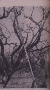
Шыватә: баг'бөбәкрыва сәдә ноһйна Эҷимәһийә №9 Мхит'арян ч'өһдә баг'э зардәдә Һ'эһубуйи д'эһәр'ә.

Шыватедә колхозована п'эре данына пещәһә сөрвейти колхозей т'эвдә, воки кемасид кб нава хэбәтә маһубуна гөһидитне моталдә һасләтә бөһә хэбәте у иседа плана колхозе бона д'эһә зедэкрыва һасләтә бөһә хэбәте у иседа плана пөһбө, т'эһийә, готит, шир у һасләтә майин жи вөдә зүт'э б'эриданыи у бе дәстәничәд пещәһә һөһә а'йла 40-салыйа Эрмәнистана Совете б'эһә к'ышнэ. Т. Мурадов