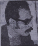
الشاعر قاسم حداد

شاعر بحريني كبير ، متزوج وله طفلة وطفل ، عضو أسرة الكتاب والأدباء في البحرين ، صدر له عدة روايات شعرية هي : البشارة ، طروب ربيع الربيع ، السنين ، والدم الثمين بواسطة الناشر الوديح داخل السجن رقم حاله الرضوية .