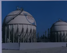
أعلى: مستودعات تخزين كور بد القليل الأحادي. أعلى إلى اليمين: غرفة التحكم بالكمبيوتر.