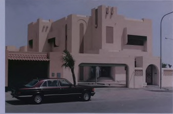
تطور المنطقة السكنية الدائمة