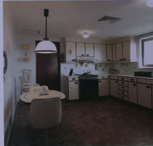
بعض النماذج التي شيدتها الصناعات الأساسية بالجبل، الصفحة المقابلة: أحد مساكن شركة الجبل للأسسة (سماة) والتي قامت شركة (آر إم) الهندسية بإنائها.

السكنية التي قاموا بإنائها ومناقشة المشاريع المقترحة والأسعار وإمكانية الدخول في إتفاقيات مع الشركات لتوفير المساكن المطلوبة للقوافل ببرامج هذه الشركات.