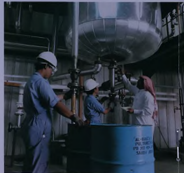
أعلى: خزانات المزج التي يتم فيها البوليوليد مع مواد أخرى لإنتاجها بعض المخصص للاستهلاك.

وقد ترأس الإجتماع سمو الأمير عبدالله بن فيصل بن تركي آل سعود الأمين العام للهيئة الملكية والذي نادى بخلق مزيد من التعاون بين المؤسسات الحكومية الهمة بالصناعات الفرعية. وطلب سمو التقدم بقرحات مدروسة لتعريف بقرص الإستثمار التفوية في المنبتين الصناعيتين والحوافز التي تمنح للمستثمرين السعوديين والأجانب في هذا المجال.