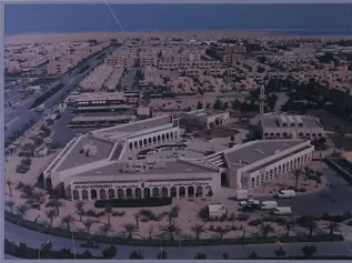
أعلى: منظر جوي لمركز حارة الروضة تحت الإنشاء، مكتبة ورياضة وأحد محلات أدوات التجميل.

يشغل القيمين في مدينة الجبل الصناعية إلى مراكز الحارات لتقديم الخدمات الضرورية. وتقع هذه المراكز بالقرب من المساكن وتشمل المرافق التجارية بالإضافة إلى المسجد وروضة أطفال وملاعب.