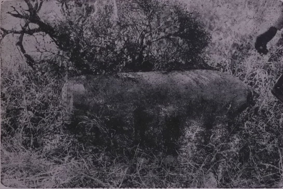
هذه القنابل المدمرة التي تهديها يوميا قوات العدو الى المواطنين

المواطنين وحرص قابوس والمرتزة والاردنيين والفزاة الايرانيين على انقاذ وليطبعوا في الازهان صدق ما يقولون ابروا صورة الطفيلين .. لكننا نريد ان نطرح على