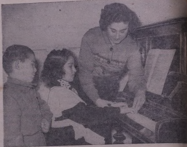
Мэр'эзэ нэ'йя Мегриэда ивал мактаба й'эвэсэлайей сэдэ дигэ йэтичэ вькэри, к'идаре нэ'йя 34 ар'эе колхозчана, п'ада у чидэ йинбэ.

Шыкьлэз дордэра сэбэидэ М. Асланян шагарт'эвэ к'э т'эзэ.