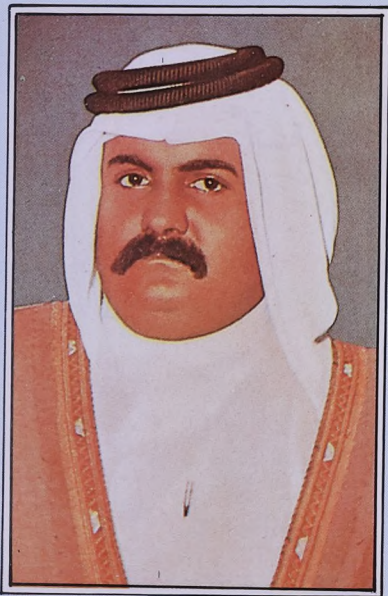
سمو الشيخ محمد بن خليفة آل ثاني ولي العهد ووزير الدفاع والقائد العام للقوات المسلحة