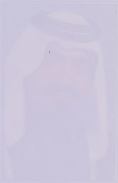
H.H. Sheikh Hamad Bin Khalifa Al-Thani