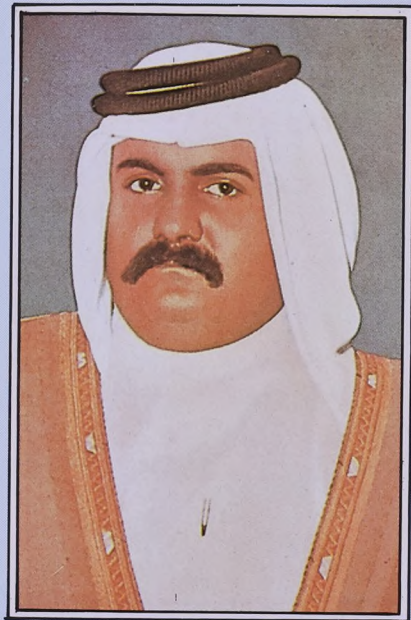
H.H. Sheikh Hamad Bin Khalifa Al-Thani Heir Apparent, Minister of Defence and Commander in Chief