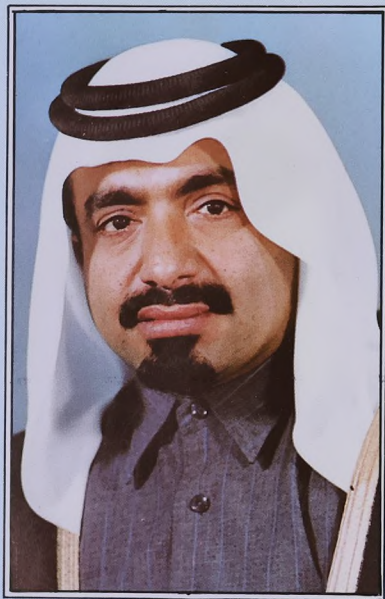
حضرة صاحب الامور الشيخ خليفة بن حمد آل ثاني امير دولة قطر