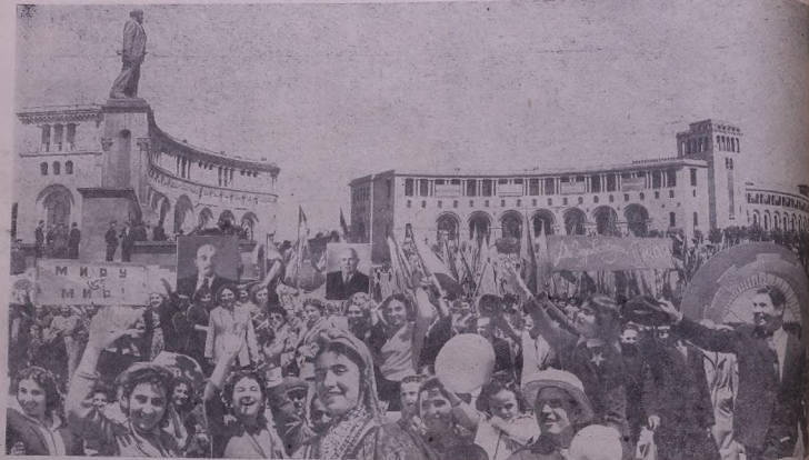
Ереван. Демонстрация хэбэт'арайэ 1-е Майе лъ майдана Ленини.