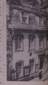
Ль бьжаре Грине те мэ Маркс'э жь дьла х'во буйа. Фотохроника