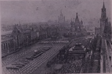
Эйла 1 Майе ль Москвае саалэ 1958. Шывалэда:— физкультурник ль майдана Сор.