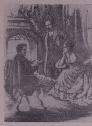
Пенрих йайне шом Кара у Женни Маркс'э ль Париже (сада 1844).

Жь шөдэ пендауытэина х'вада марксизм рөкэ мээын у санагэ дорба буйа. Вьме Маркс'изм т'эво пенда нава т'эрфордерде е йимэжк буй. Не ови б'лмн х'вар'эр у па к'арь бор бэ ф'омдэрияи мэрвөд ми шөхэйтия ард у пеш. дьна зөф т'э