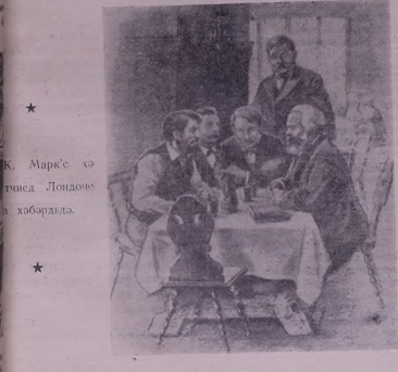
К. Маркс'э хэвэшэд Лондонэ у хэбэтк'арайэ.

Сор п'арчед сор, к'о б'эвэд гэр'эвнэ, ивэнишэ: Синат партиа мэр'ал. Ль демонстрасиа 1-е Майе хэбэтэ (Пайг'атын рэс 4-а).