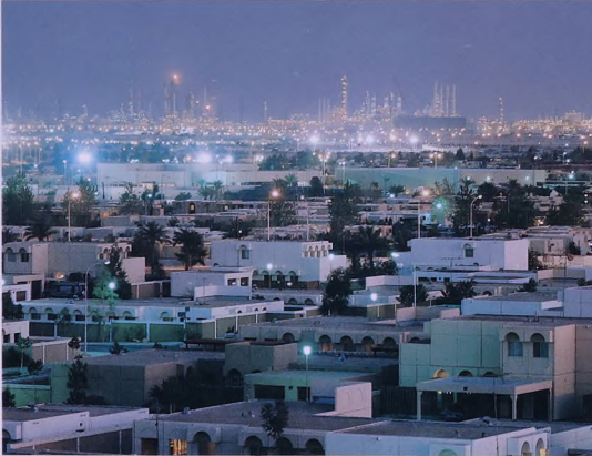
مدينة الجبيل الصناعية بعد عشر سنوات من النمو المتواصل

مدينة الجبيل الصناعية : شوال ١٤٠٧ هـ العدد الخامس السنة الثانية