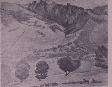
Балхоса Каринише д'а Ч'йае Т'юмаг'ийа

Бона 80-сака буйна шьвалг'ешине мазауц'ид науцае у й'б'юб'ите шьвалг'ешид Оми Академиа Т'РСС багьвалг'ешид а'йин у Академиа Академиа Т'РСС Армистанвайи Оми ба'йи ц'юм'юб'арий у