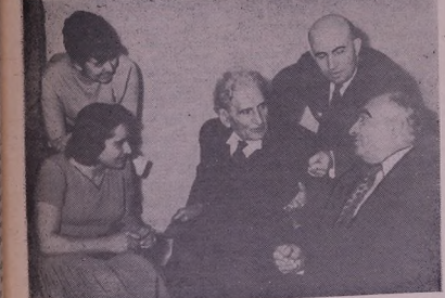
Шьвала: М. Сарйан к'юва шьвалг'ешид Г'ористане у Армистанвайи искусствоа р'юка г'юза.

лек п'ежайажи хьвайи к'ава нава шьвалг'ешиднава армянвайи п'ежайаже р'юка г'юза мази у маже хьвайи мази мази нава ми шьвалг'ийа.