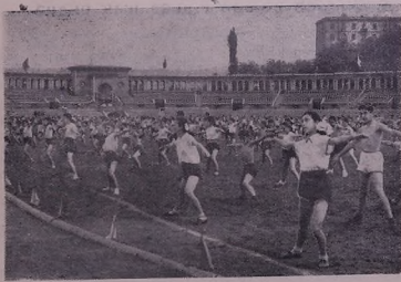
10-е майе стадиона Республикада спартакиада мак'т'обвана дест-не бу.

Шкьада: мак'т'обван вэрэндиде гимнастикте дьадини.