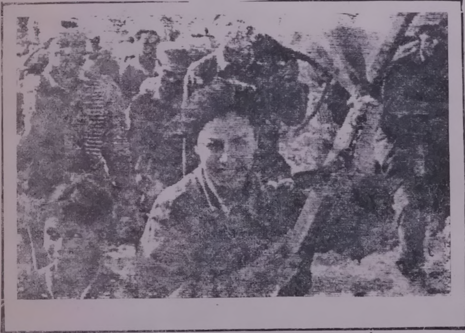
"ارتفعت رايات النصر في جزائر الثورة"

ان الثورة الجزائرية جسدت مبادئها في كافة المجالات المحلية حققت انتصارات ضخمة في ميدان البناء الاقتصادي والاجتماعي وعربيا ووقفت الى جانب حركات التحرر الوطني العربية داعمة ياها ماديا ومعنويا وعلى رأسها لثورة الفلسطينية والعمانية والصحراوية الغربية كما انها احثت الركائز الاساسية في جبهة الصوم والتصدي، وعالميا ووقفت الى جانب نضالات الشعوب في افريقيا واسيا واميركا اللاتينية. ان شعبنا العماني تم ينسى موقف الجزائر من قضيتهم العادلة على مختلف المستويات ان يعتبر انتصار الثورة الجزائرية انتصارا لثورتهم ولطموحاتهم في الاستقلال الحقيقي والحرية والديمقراطية. ستبقى ثورة الطيرون شهيد نبراسا يضيء الطريق امام الشعوب المكافحة من اجل حريتهم واستقلالهم وتقديرا لاجتاعي.