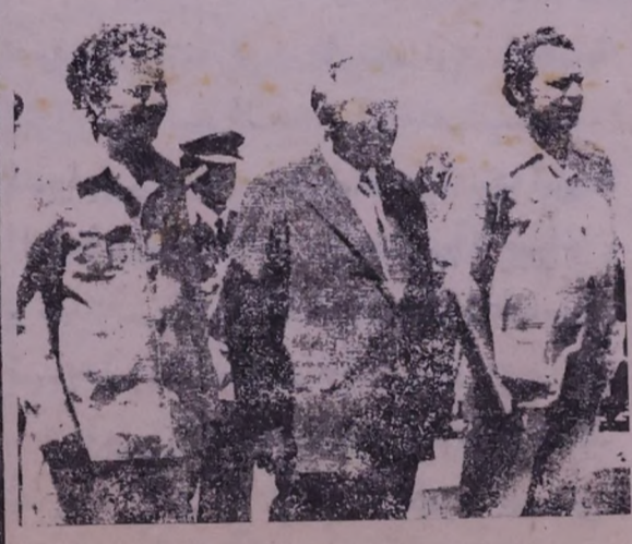
الداعم لنضال شعبنا العماني يمثل التجسيد الحي والفعال للحلفاء الاستراتيجيين للشعب العماني بقيادة الجبهة الشعبية لتحرير عمان التي تناضل ضد نظام مسقط الخائن وكافة القوى

العسكرية الاجنبية المتواجدة على الارض العمانية من ايرانية وبريطانية وغيرها اضافة الى التواجد العسكري الاميركي في جزيرة مصيرة العمانية. ان جماهير شعبنا العماني تشن المواقف المبذولة لكل من جمهورية اليمن الديمقراطية الشعبية وجمهورية بلغاريا الشعبية تجاه نضال شعبنا وثورته النافرة.