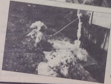
Sefaköy, İstanbul 1997 Mayıs, önce yün yatakları atılıp, sünger yataklara geçildi. Sonra yün yatağın zahmetine rağmen rahatlığı...Eiller su toplamış, yaralar açılmıştır.