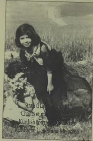
Stran û Leşkerî Kurdî Charits et m... Kurdish songs and melodies Kürdische Lieder und Melodien

Butu omnon şiyene bijeku roza hata sonde tij vera-vesene bijekura hasnikerdene roze huwira nıken dumone apemı hire brayemı şünetkene mi, çiçeğ vetene niyeso hodeniyu zu hette meyman