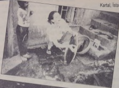
Kartal, İstanbul, Mayıs 1997, Şehre geldik ama, ne içecek suyumuz ne yunacak hamamımız kapkacaklar, çeşme başı, kapı önlerinde sohbetleri yerine....