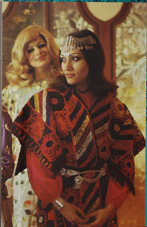
Folk costume inspired by the traditional designs used for rugs in Samawa City in the south of Iraq. Costume folklorique inspiré des motifs traditionnels des tapis de la ville de Samawa, au sud de l'Irak.

Au cours de la période kassite, la priorité va à la décoration. Le costume assyrien semble avoir été le plus riche en ornements et broderie, mais aussi le mieux adapté au progrès industriel et technique. Les bas-reliefs en montrent clairement la qualité la beauté et la dignité. Dar al Azia s'en est inspiré. Certaines de ses créations évoquent le règne du grand roi babylonien Hammourabi dont le nom évoque encore la justice et les lois qu'il promulga, alors que la "procession royale des Assyriens" donne à l'assistance un mélange agréablement poétique de fantaisie et de réalité. Les siècles ont passé, et avec eux la fortune et le malheur des peuples. Entre le 1er siècle avant J.-C. et le 3e siècle après J.-C., une civilisation arabe s'inspirant de l'héritage de la Mésopotamie ancienne a fleuri à Hatra. Ses sculptures montrent des vêtements d'une beauté remarquable, et dont le travail et les ornements en font des oeuvres d'art brodées et rehaussées de pierres précieuses. Dar al Azia s'est inspirée de Hatra pour présenter une version moderne du costume de la princesse Dashfari qui constitue une remarquable alliance de beauté