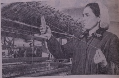
Техса шькыные фабрика Беранейо чьх. Шькында: Олга Костайн'и'а вьдэ хобатэ.

П'ада, хобатчын шькьенер-теханик сьонийа республика ма бь фраред фр'ы'т'а партиа Коммунист'и'е Т'и'ф'а-лэ Совете ХХ р'ол'д'ар'уи'н, к'эз'и'нэ нава л'оша бьр'и'мьае у дьг'и'н'ш'и'я ачындэ хобатей т'эзэ.