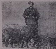
Шьвәдә: шьвәи Усө Усө шәм миңә көч'ар бәрх аиңә.

Колхоза ви гөндәдә ми Пашә чәмә шьвә Әвнә рьд мьдәтә дь дькың. Бь сәйә хәбәтә исәл жь 203 ми зәиң тьшә стәшәиң. Мийә М. ашйә. Вьра бәрх п'әк рьнә.