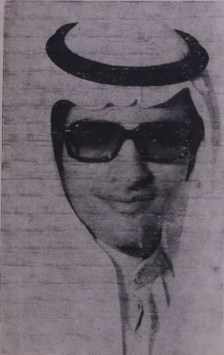
الرفيق سعود (سلطان) .. مرحبا بالموت في سبيل عمان في سبيل ارضي .. حريتي .. كرامتي ..