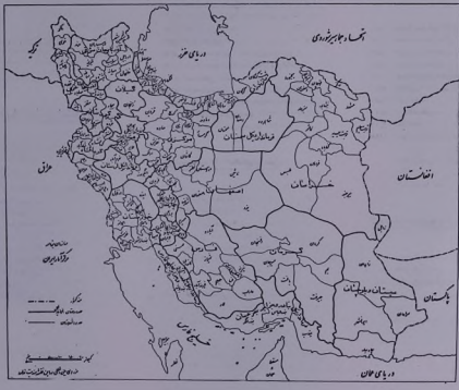
تقسیمات گزینش در استان البرز، سال ۱۳۴۵ شمسی