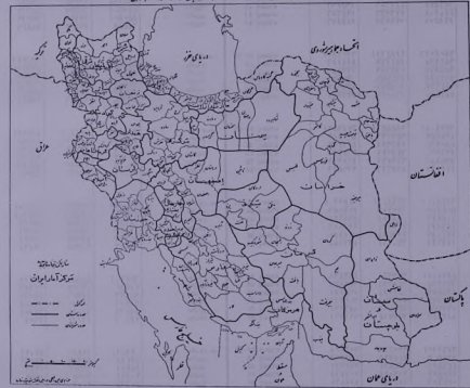
تقسیمات گزینش در استان البرز، سال ۱۳۴۵ شمسی