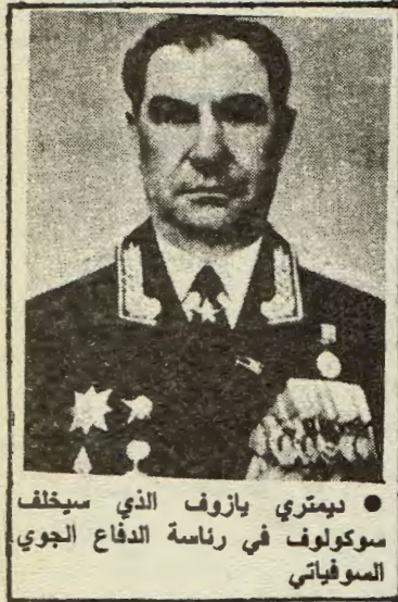
● ديمتري يازوف الذي سيخلف سوكولوف في رئاسة الدفاع الجوي المسوفياتي