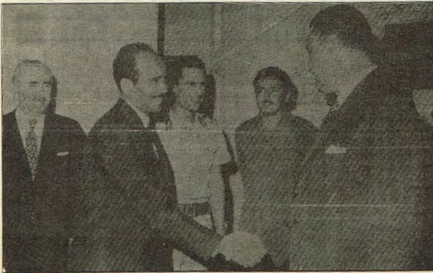
كرامي في احدي لقاءاته مع الزعماء العرب

١- ان العمل الدؤوب لعقد مؤتمر دولي ينبري الصراع في المنطقة من خلال الاعتراف والصلح والاقرار بدولة العدو ، وتقاسم الادوار مع الملك العميل في الاردن ، وقيادات فلسطينية تقبل بدويلة مسخ في الضفة والقطاع ، وسيكون الموضوع