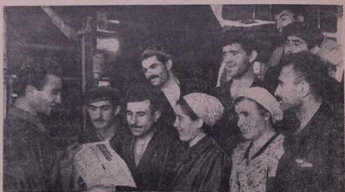
П'алед э'авода Ерванедә г'әкәрел анта бы һ'әтәш'арисо мезь насала хьә дьдәкә фьидә тед П'ануна КМ ПКТ'С.

Тема у агитатор'а бона фьондел агитатор'а.