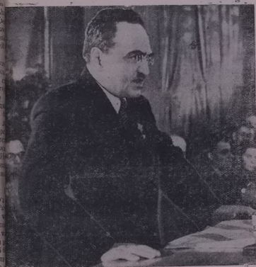
Һөвале А. И. Микоийан шьвата