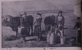
Шыкэда: Ч'елэқдшэд колхоза гондэ К'волянуйеи пэш ле ияр Эцимидане Чинара Шэмо. Быхара Қорэ у Сб'т'ана шяр т'э'эслии сар'ере ферэе дэжиш

Директоре мак'т'эба гондэ Тэлык һ'э'ф'эста ле һинбуи Тэ-лыне.