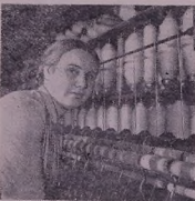
Нина Валентина Гаганова нава отпускедана, д'е йһә жи әв галәк шара д'әбә фабрике.

Шыкыда: Мерхаса Хәбата Социалстие В. Гаганова.