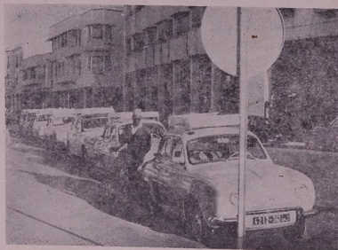
Марккә. Шцә сәһәһиңдә һәтәһиң п'әһт'әхтә вәләт Раба-тәдә. Фото йә А. Вәлсәсә Фотохроникә ТАСС.

Пекин (ТАСС). Чавә мьдәләдә агентһиә Синхуә жи Шанһәйә әләм дькә, һәвә 11 мәһәд сала 1959-адә т'әһиңкәләд дәстхәкәнд Шанһәйәд партиәә 36 һ'әзәр п'әлә кандидатә дәһтиә Партиә Комунистиәһә Чингәһә (ПКЧ) әбүлүкәриә. Дәстхәкәнд сәһәлә мөталәһүриәдә 2.200 мәрвән зәдәтә к'отыһә һәвә шергәд ПКЧ. П'әр'әһиә мәрвәд ко кандидатә дәһтиә партиәә һәтәһә сәбүлүкәрә һәвәләд дәрәһиңә.