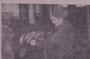
Трактористе колхоза сэр нэве Сталин (н'б'иша Стен'апановэ) П. Фриг бэиэ п'анат дэча сосиелатне у борц н'эв'антэ сэр хэуэа хэбэте г'юээриэра трактора хэуэа "ДТ-54" п'анат 15 р'юнаде хэуэа. Шимэдэ: П. Фриг воэте хэбэте.