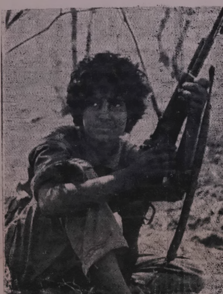
كلها عليها تعمل على تحرير نفسها من الاضطهاد الواقع على مواشيها وهي تشارك بفعالية في الثورة وهي بذلك صورة لاحدى الرفيقات في جيش التحرير الشعبي وهي تمثل نموذج للمرأة في «ظفار»

بتاريخ ١-٩ قامت الطائرات البريطانية بغارات وحشية على اماكن المواطنين العزل في مرتفعات اقيشان وعلى الفور قام رفاقنا الابطال بالتصدي للطائرات المغيرة حيث اجبرت على الفرار نتج عن ذلك اصابة احد رفاقنا الابطال بجروح طفيفة كما اصيبت بعض مواشي المواطنين