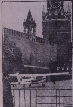
● الطائرة في كرميلين

الدفاع السوفياتي. ولكن من ضمن ان البيروقراطية لن تدع الايركان يعقون اقتراعات حساسة ضد الاتحاد السوفياتي وبلدان المنظمة الاشتراكية اذا كانت عقلية التباطؤ وعدم اتخاذ القرارات الحاسمة والسريعة هي إحدى صفات الجهاز البيروقراطي. وفجأة عبط طائرة مديّة صغيرة لغمار المائي مشبهو اخطرق دفعات الاتحاد السوفياتي لمدة اكثر من خمس ساعات، وتزلزلت به في الساحة الحمراء، امام ضريح لينين وكان يمكن ان يعمل قبيلة ذرية او متفجرات، او اسلحة جرموية غير ذلك، والاذن من ذلك انه نزل من الطائرة، واخرج من جيبه ماشين بوزعهما على الجمهور الذي فتح فاه مستغرباً حصول هذا الشيء، في بلد الاشتراكية النبع، والذي يتصلق للامبريالية الامريكية، ويعترف للمبارك لتصدق دفعات جيدة لا تسمح للاميركان وقوات الاطلس ان يشنوا هجوماً مباغتاً على الاراض السوفياتية. لقد كانت مفاجئة فعلا ليس فقط للقيادة السوفياتية، وليس فقط لكل القوى التقدمية التي تتقف في المعسكر وادع مع الاتحاد السوفياتي، وانا ايضا للدلائل الامبريالية التي وضعت للمبارك من الدولات لتطوير اسلحة هجومية قادرة على اقتحام الدفاعات السوفياتية التي يجسب الغرب الاسريال لها حساب. وجاء الرد السريع من القيادة السوفياتية بتضحية وزير الدفاع وقائد الدفاع الجوي وعدد من العسكريين الكبار الذي توهوا بان ماتهم العسكرية يمكن ان تحمي جلودهم، وبات واضحا ان مثل هذه الضحية ليح ا تراكميا للفساد الاداري والبيروقراطية التي تتأصل القيادة السوفياتية الحاملة لتخليص الاتحاد السوفياتي منها ليكون اكثر قدرة على الطاعة في خلف مفاين الحياة المدنية والروحية ويكون اكثر قدرة على الدفاع عن الانجازات الاشتراكية من جهة والسلم العالمي من جهة ثانية. رب ضارة نافعة.