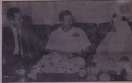
امير البلاد استقبل قائد القوات البحرية الاميركية في الشرق الاوسط

فقد اضى مولدها مورفي في منطقة نفقيدة لاعادة الثقة لعملائها في المنطقة ، وتيمه الاميرال يتسون قائد القوات الاميركية في منطقة الخليج ليمزج بين المصدقية ، وهامي سفينة الحامية الاميركية تفر صرعة أحد الدوليين المتحاربين . ومن السخريه أن بعض المسؤولين في واشنطن حاولوا تحميل السعودية لتشلهم لعدم اعتراض طائرتي اف - ١٥ السوفيتين للطائرة العراقية ، بمد مباحثها من قبل الاوكس . ودرهم عدم رغبتنا في الدخول في مناعة الولايات تقربها علينا بالتدخل ومنعها قواعد عسكرية حتى نستطيع التدخل بفعالية ، وكان المشد العسكري الاميركي لا يكفي ، كما كثر