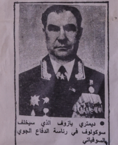
● ديمتري يازوف الذي سيخلف سوكولوف في رئاسة الدفاع الجوي السوفياتي