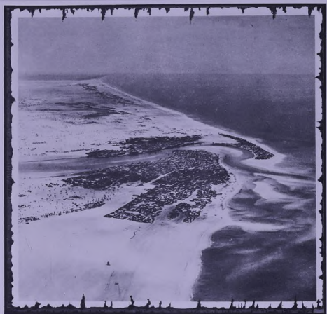
Dubai during 1950s