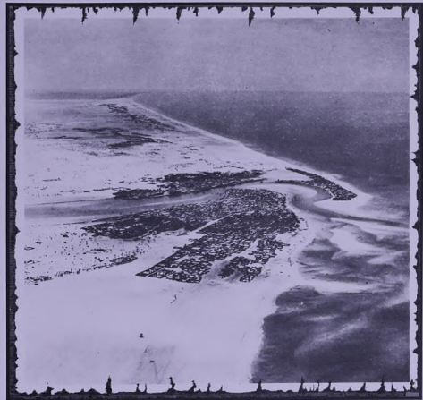
دُبَيِّ فِي الْحَمْسِيَّاتِ