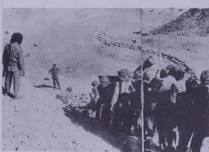
حاطب بريطاني يتودع جيش المرفزة الاولى الموجع والمرض والمصدرد .. مجرات نظام قايس السبيل