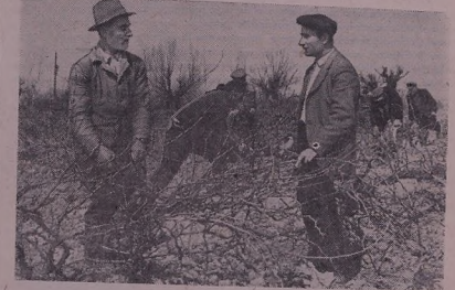
Баг'аннелд колхоза Ноксеберде...