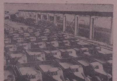
Р'еспублика Чингизтейа Шымаг'те, З'авода Чынаркырыне автоматийа №1, йа бы ак'идайын Т'фада Советиа йа-т'е ч'екерне, З'авод автоматийа шур'э-Т'С'ар' (з'авод) бардала.

Э'ламэтиия ТАСС-е Сар й'име програма з'ег'арийа мезина космикне у планетед система т'е 2-е апреле сала 1963-а Т'фада Советиед р'акета космик бар'б й'иле б'иарад. С'ва дорача р'акетейа п'ашы д'орх'эныа сор орбита д'оргор'а Э'р'дед й'б'артийа ор'га, де паше старт й'ада у д'арк'эты сор тракториия й'ожандыныа к'ышыкыри. Й'б сор р'акета космикне стансиа «Йив-4» автомат г'юити п'ашыкырыне бы к'аша 1422 килограмм. Стансиа «Йив-4» автомат те се р'о'ж у й'ива шунда б'ыг'ижа на-й'ийа й'иар. Й'ому апарат, к' сор стансиа автомат йаг'ын чымаркырыне, нормал д'обхотыны. Ленн'ер'андыа ф'ирныа стансиае, Ч'ОМ П'ЗМАМЕД М'Э К'ышыкырына параметред траекториия те, стандиа информация б'иари й' сор Э'рде теиз маисаркырыне территория Т'фада Советиед—бы д'ести комплекс'а ч'апкырыне мах'ус. Р'езултатед к' й'отаны й'на йаг'ын г'омаркырыне п'араметр к'ышык, жокн стансиа автомат бы траекториия незики йа й'асабкырыа д'эчэ, 2-е апреле сала 1963-а, бы во'з'акн Москвае с'б'этыа 16-а стансиа де Москвае с'б'этыа ж' Э'рде дур бы, жи й'откыра п'аше Э'рде к' координатед те з'ани: 122 д'арк'а 37 д'эчэ д'ерейа р'о'йальте у 38 д'арк'а 56 д'эчэ барайа ш'ымае. Э'ламэтиия майны д'арк'а ф'ирныа стансиа «Йив-4» автоматда бы 3-е апреле те дайныне.