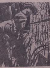
(Յոր): Փօթ ի՛ Ք. Շօղալոն