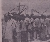
Սեպուհլիս քրքրոցուա ճոնա-ԱՄՈՆՈՒ ԲՈՆԱ ՏՈՒՃՈԼԵ ՎՃԼԱԷ.— Էիս արցւոյ Խոր թուի- ցիս քրքրոց թրսւտ- ԸԻՏԱ ՄՉԱԲԼԻ ՆՍԱԵ ՔՐՈՎԱՆԱՏԻԱ ԸՆԴԻՆ.— ՆՈԼՈՒՅԱԼԻՏԵՒ ՔՐԱՆՏԻԱԷ ՆԱԿՄԵԾԻՆ, ՄՈՒՆ ԸԼ ՎԼԻՔԻՐԵ ԵՅԵՑ ՎՃԼԱԷ